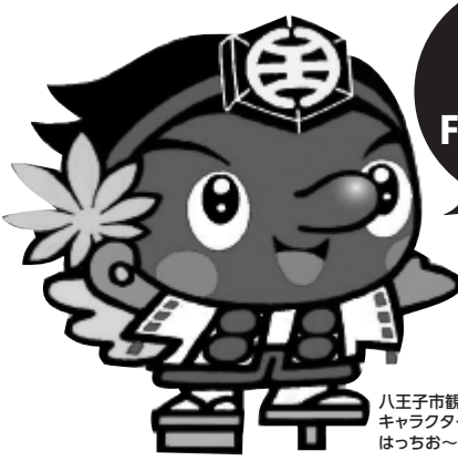
八王子市観光PR キャラクター はっちあーじ